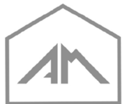
Apotheke am Markt